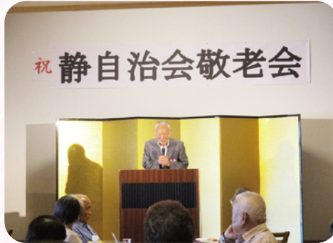
昨年度も地域の敬老会の受け入れを積極的に行いました。