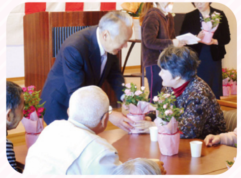
作業手伝いをしてくださる方に感謝を込めて鉢植えを送りました。