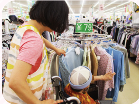
買い物外出では、各自思い思いの服を選びました。