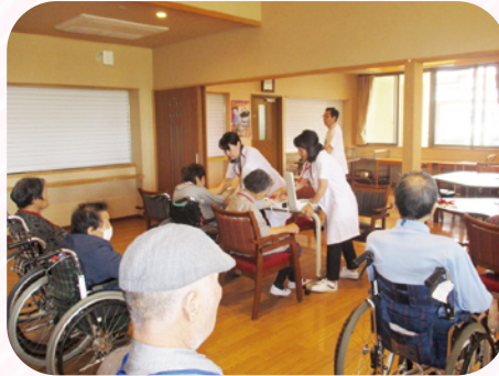
全入居者対象に健康診断を行いました。