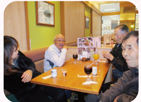
誕生月者で希望者を募り、食事・買い物外出をしました。