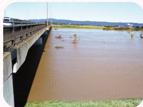
常陸太田市と那珂市を結ぶ木島橋から見た、台風19号の久慈川の様子