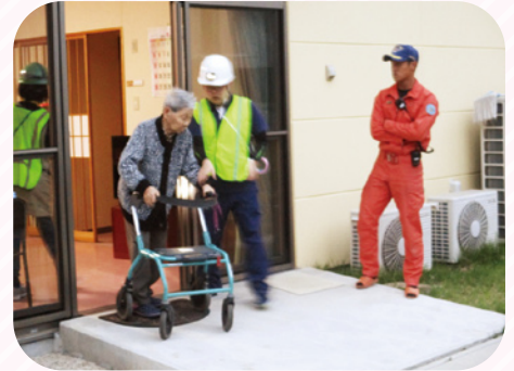
消防立ち合いの元、夜間想定避難訓練を行いました。