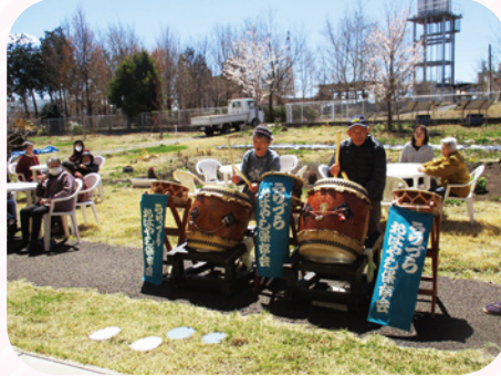
快晴の中、お花見をしました。