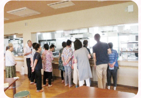
民生委員や施設職員の施設見学の受け入れを行いました。 キッチンでは在宅へのお弁当を 365 日作っています。