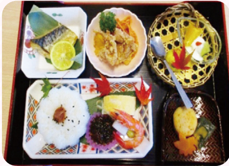
那珂御膳も好評でした。