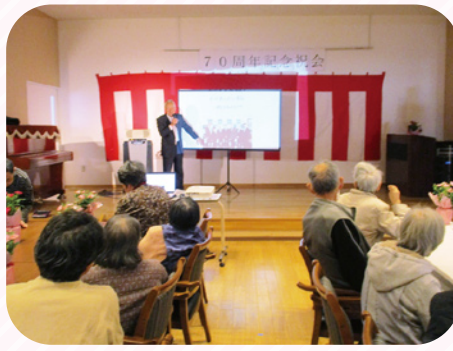
創立記念祝会で 70年の歴史を振り返りました。