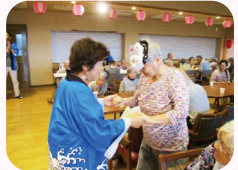
納涼大会では、うりづらおはやし保存会の演奏を楽しみました。