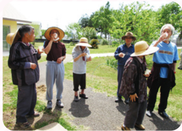
水分補給も忘れずに！

面会時には、面会者に右記のチェックシートの確認をさせていただきます。ご協力よろしくお願い致します。