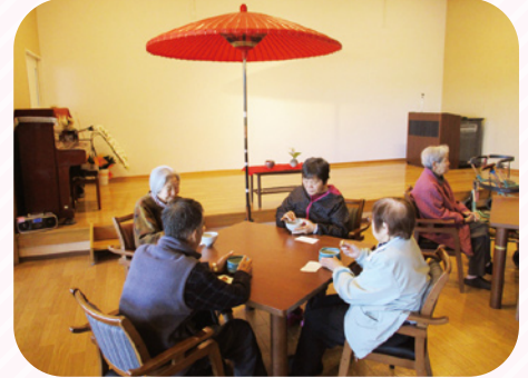
お抹茶と菓子を味わいました。