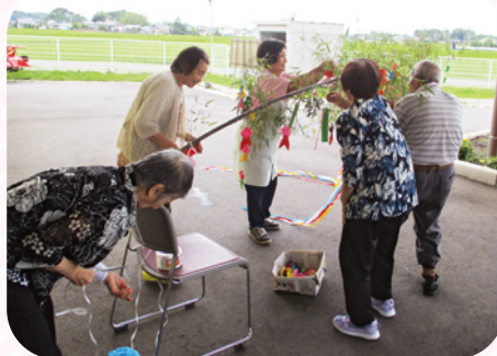
七夕の飾りつけをしました。