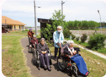
天気の良い日には施設の庭を散歩しています。