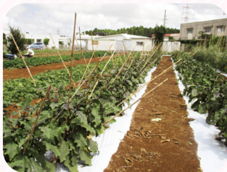
おいしく安全なナスがたくさんできました