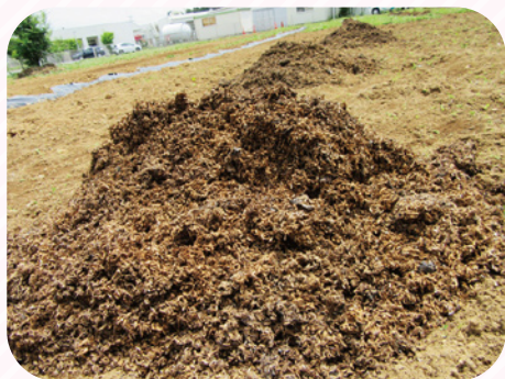
食品残渣を資源とした肥料

施設で取り組んでいる地球温暖化対策（薪づくり、井戸水利用、循環型農業）について、市で発表も行いました。みんなで頑張りましょうと呼びかけました。