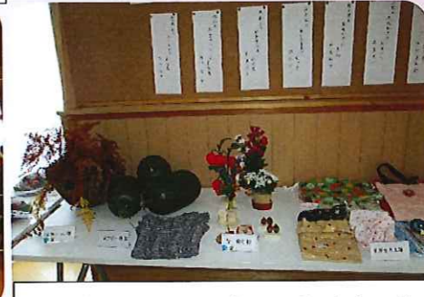
文化祭では、入居者のみなさんの作品を展示しました。