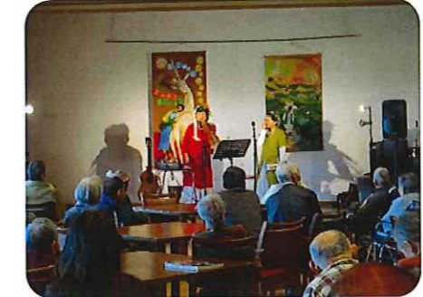
唄や踊り等、たくさんの慰問があり、楽しみました。