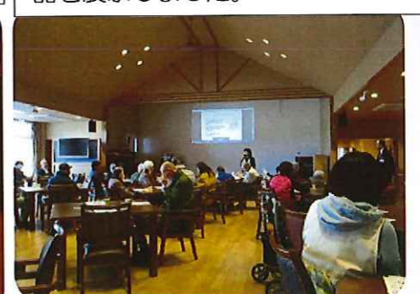
口腔衛生について講習会で学びました。