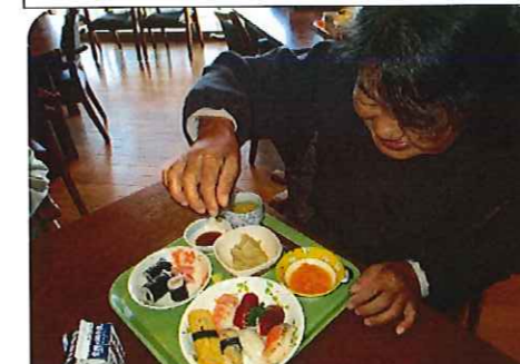
特別献立は、希望の多かった生寿司でした。