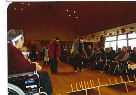
とても盛り上がった運動会でした