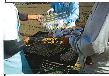
银杏畑でとれた银杏をおいしいいただきました。