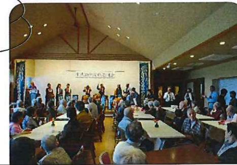
敬老会にて長寿をお祝いしました。