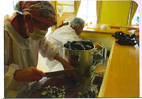
施設の畑でできたナスでジャムをつくりました。