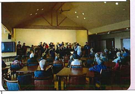
瓜連中学校の吹奏楽部の皆さんがミニコンサートを開いてくださいました。